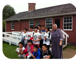
滑铁卢地区博物馆