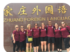
第一天教学活动后学校合影

今年七月, 我们8名滑铁卢地区天主教教育局的老师有机会来到中国, 在河北省石家庄市的石家庄外国语学校参加了为期两周的夏令营活动。夏令营包括在校内的教学活动(小学和中学课程)和文化体验。我们与来自世界各地的教育工作者进行了交流, 分享了最佳教学实践, 建立了合作伙伴联系。文化体验包括参观龙门石窟和少林寺, 游览北京的市场, 当然少不了“不到长城非好汉”。我们还与当地家庭一同参观博物, 领略茶道文化, 制作传统水饺。