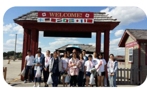
St. Jacob's 农贸市场

来自河北正定中学和石家庄外国语学校的80名师生于7月份参加了滑铁卢天主教教育局的夏令营醒目。他们不仅体验了加拿大课堂，锻炼了英语技能，还通过参与各种课外活动了解了加拿大的文化、饮食，并参观浏览了安大略的著名景点。