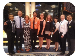
教育局员工与日本教师合影