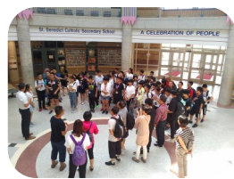
参观St. Benedict 高中